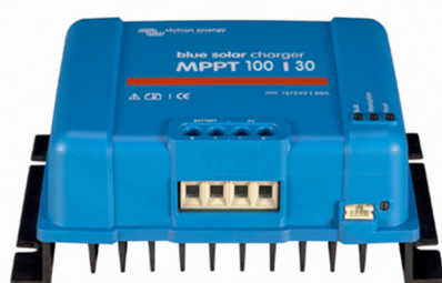
Solar-Laderegler MPPT 100/30