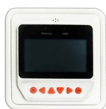
BlueSolar Pro Fernbedienungspaneel