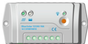
BlueSolar PWM-Pro 10 A