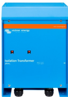
Isolation Transformer 3600W

Es ist zu empfehlen die Erdung der Sekundärwicklung auch bei Lagerung an Land (z.B. im Winterlager) anzuschließen um auch dann eine maximale Sicherheit zu gewährleisten.