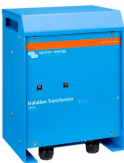
Isolation Transformer 3600W